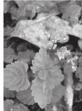
Véronique des bois ( Veronica montana )

Le nombre de quadrats, présentant une, deux ou aucune des espèces, a été compté et enregistré. Les fréquences observées à partir de 150 quadrats sont présentées dans le tableau de contingence suivant.